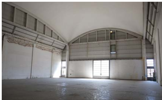
Ex-CSAC - Vista interna padiglione centrale