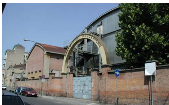
Ex-CSAC - Prospetto su via Palermo