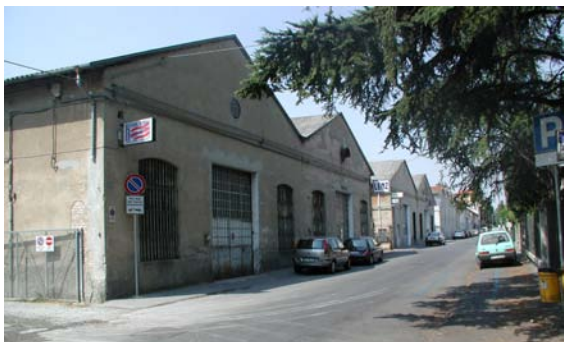
Ex SCEDEP - Prospetto

Il padiglione ex-Manzini in particolare, insieme all'ex-SCEDEP, vuole essere il cuore di questo complesso processo di rinnovamento che investe il comparto e l'area circostante, capace di consentire alla città ed al suo territorio di riappropriarsi di luoghi dimenticati e di diventare promotore di una forte innovazione sociale, culturale ed ambientale.