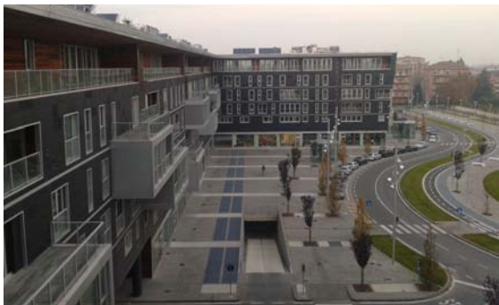
La nuova piazza urbana