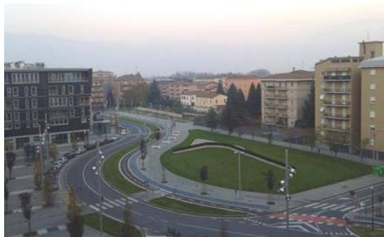
La nuova area verde