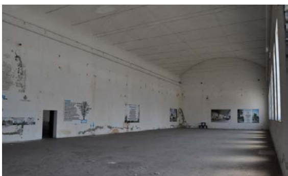
Ex-CSAC - Vista interna corpo ovest