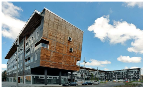
Edificio di recente realizzazione (lotto B)