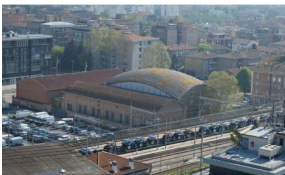
Ex-CSAC - Vista dall'alto